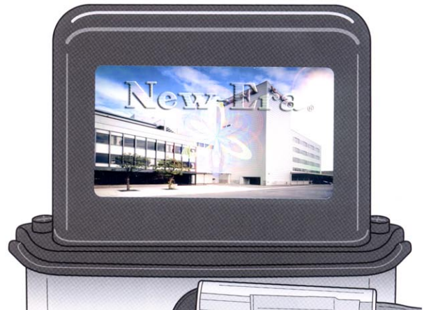
NEW ORIGINAL TYPE