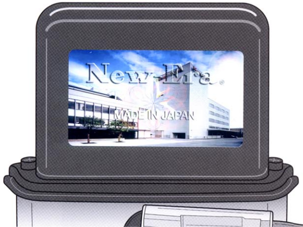
OLD ORIGINAL TYPE

يمكنك ملاحظة بعض الفرق بين الأصلي والمقلد.